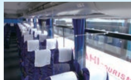
飛沫防止透明シート（一例）